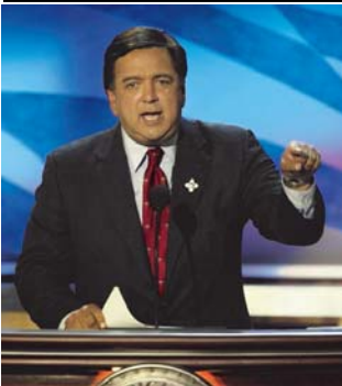
Gobernador de Nuevo México Bill Richardson

"Frente a la realidad que nuestro sistema de imponer la pena de muerte jamás será perfecto, mi conciencia me obliga a sustituir la pena de muerte con una solución que mantenga a la sociedad segura."